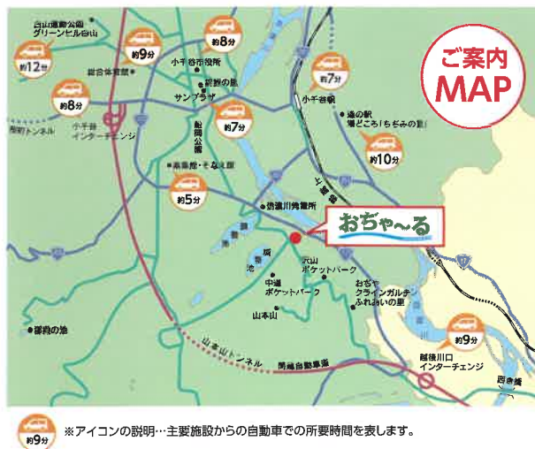
※アイコンの説明…主要施設からの自動車での所要時間を表します。